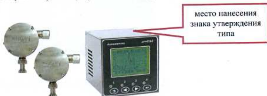
Рисунок 4 - pH-метр промышленный pH-4122, pH-4122.П (щитовое исполнение)