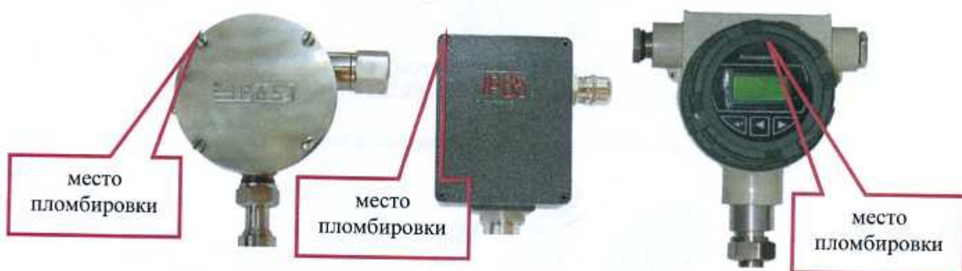
Рисунок 6 - Схема пломбирования рН-4101

Места размещения голографических наклеек для предотвращения несанкционированного доступа представлены на рисунках 6-9.