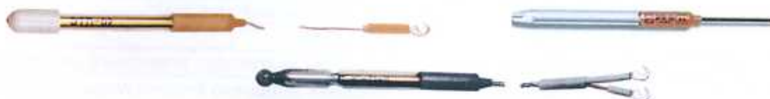
Рисунок 13 - pH-электроды ЭТП-02, ЭРП-101, и ЭС-71 серий