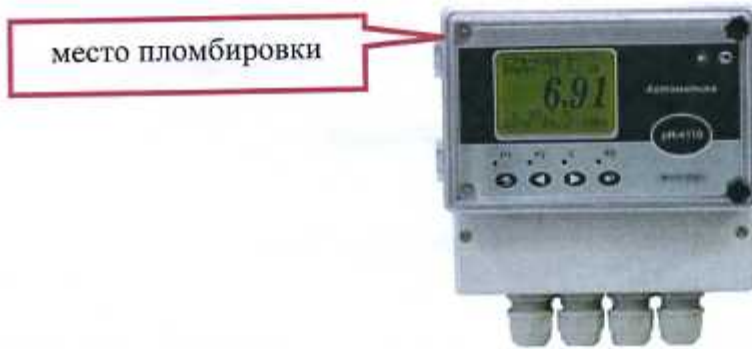
Рисунок 9 - Схема пломбирования рН-4110, рН-4122(настенный вариант), рН-4122.П(настенный вариант), рН-4131

Используемые электроды представлены на рисунках 10 - 14.