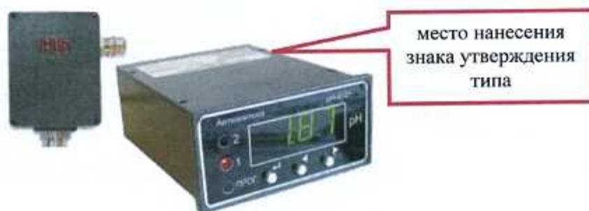
Рисунок 3 - pH-метр промышленный pH-4121