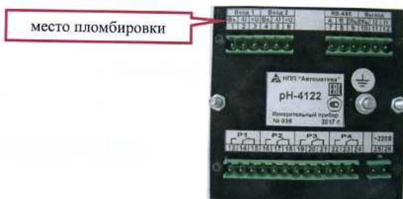
Рисунок 8 - Схема пломбирования рН-4122, рН-4122.П (щитовой вариант)