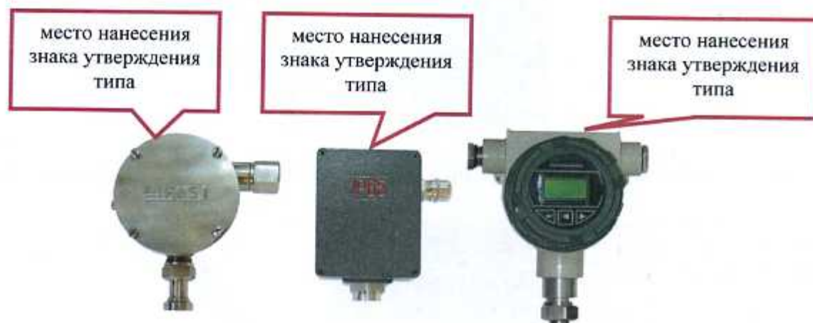
Рисунок 1 - рН-метр промышленный рН-4101 в исполнениях «Н», «Д», «И»

Общий вид рН-метров и обозначение мест для размещения знака утверждения типа представлены на рисунках 1-5.