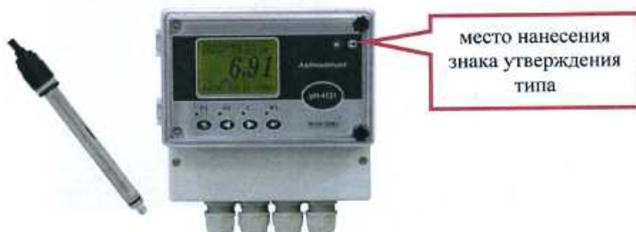
Рисунок 5 - pH-метр промышленный pH-4122, pH-4122.П (настенное исполнение), pH-4131